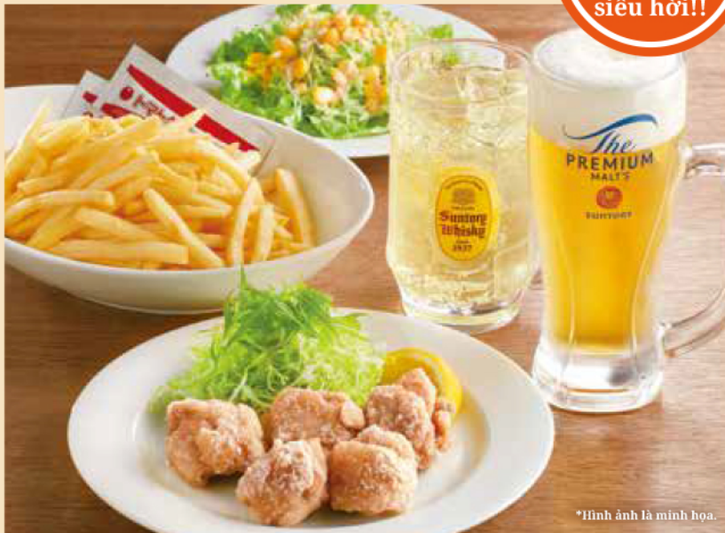
*Hình ảnh là minh họa.